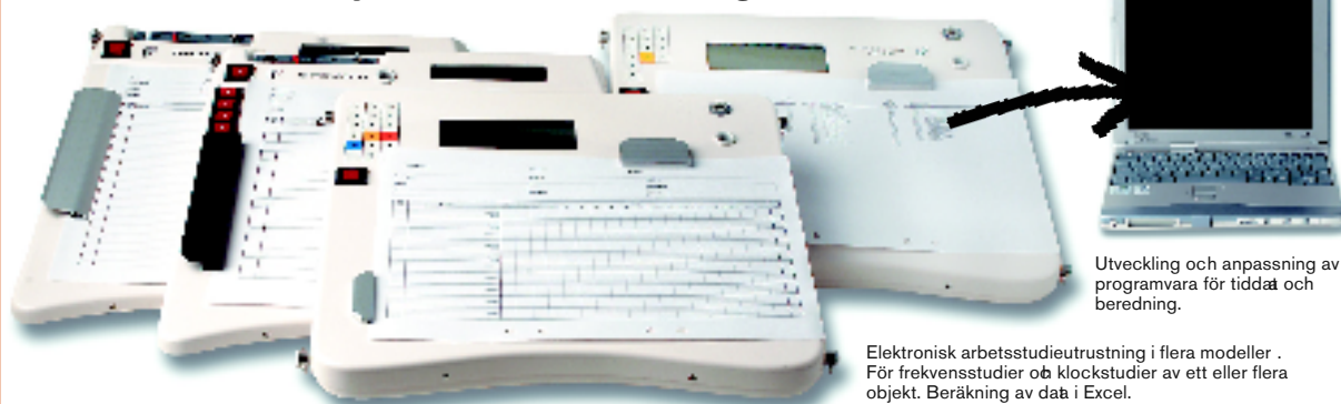
Utveckling och anpassning av programvara för tiddat och beredning.